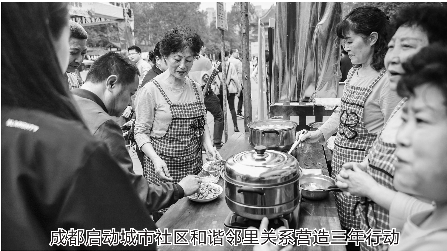
成都启动城市社区和谐邻里关系营造三年行动

值得一提的是,本次大赛还将举办全国职工大唐不夜城嘉年华活动,届时1500多名演职人员将齐聚大唐不夜城,通过网络互动、全媒体直播、电视录播等形式,面向全国乃至全球展示中国职工的时代风采。