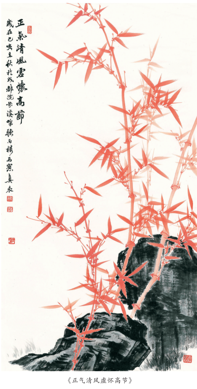
《正气清风虚怀高节》