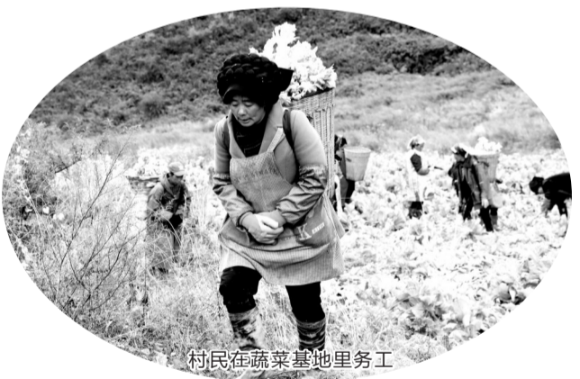
村民在蔬菜基地里务工

四川省凉山州甘洛县清水村是甘洛县最大的尔苏藏族聚居村落,拥有高原湖泊牛角海、高山草甸鸢尾花等生态资源。近年来,在推进脱贫攻坚的工作中,清水村的百姓住上了好房子,过上了好日子,形成了好风气,经济社会发展呈现一片欣欣向荣的景象。