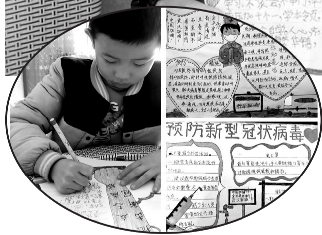
近日,湖北省竹山县麻家渡镇九年制学校通过家校合力,开展了感恩教育、卫生习惯教育、防疫心理健康教育等,由线上教学转向成长教育,引导学生和家长做一名防疫“宣传员”,为打赢疫情防控阻击战加油鼓劲。图为2月20日,该校学生展示自己绘制的防疫手抄报。