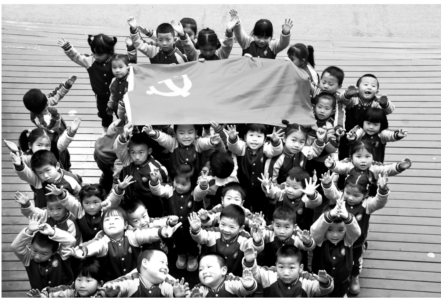
为庆祝中国共产党成立100周年,贵州省凯里市第十三幼儿园近期开展了“我与党旗合个影”等活动。图为幼儿园小班学生与党旗合影。

用好主题党日打造党史学习教育“实践课堂”。开展丰富多样的主题党日活动,组织党员干部到企业、进社区等基层一线开展实践活动,不断丰富提升自身的企业治理、基层治理、应急处突和矛盾纠纷调解以及服务基层服务群众的能力和水平。