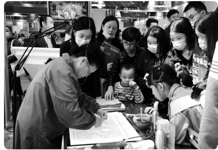
“让古书复活，让时光倒流——妙手书医”古籍修复技艺展

值得一提的是，本届天府书展首次搭建了天府书展直播平台，书展期间，入驻直播间主播访问总人次超过1200万人。2021天府书展为广大读者送上了一场文化盛宴和阅读嘉年华。