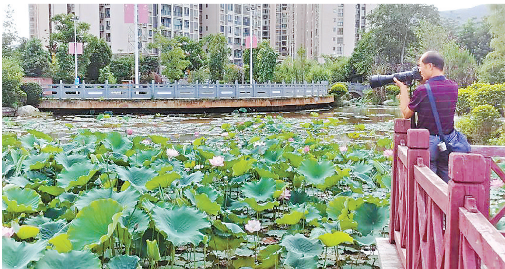
近年来,云南省南涧彝族自治县以创建全国生态文明建设示范县为契机,在严格保护耕地红线的基础上,在县城周边探索建立生态文化公园,以生态文明建设推动农业与文化和旅游业深度融合。盛夏时节,这里的荷花相继绽放,吸引广大市民前去休闲观光,形成“映日荷花别样红”的诗画风景线。