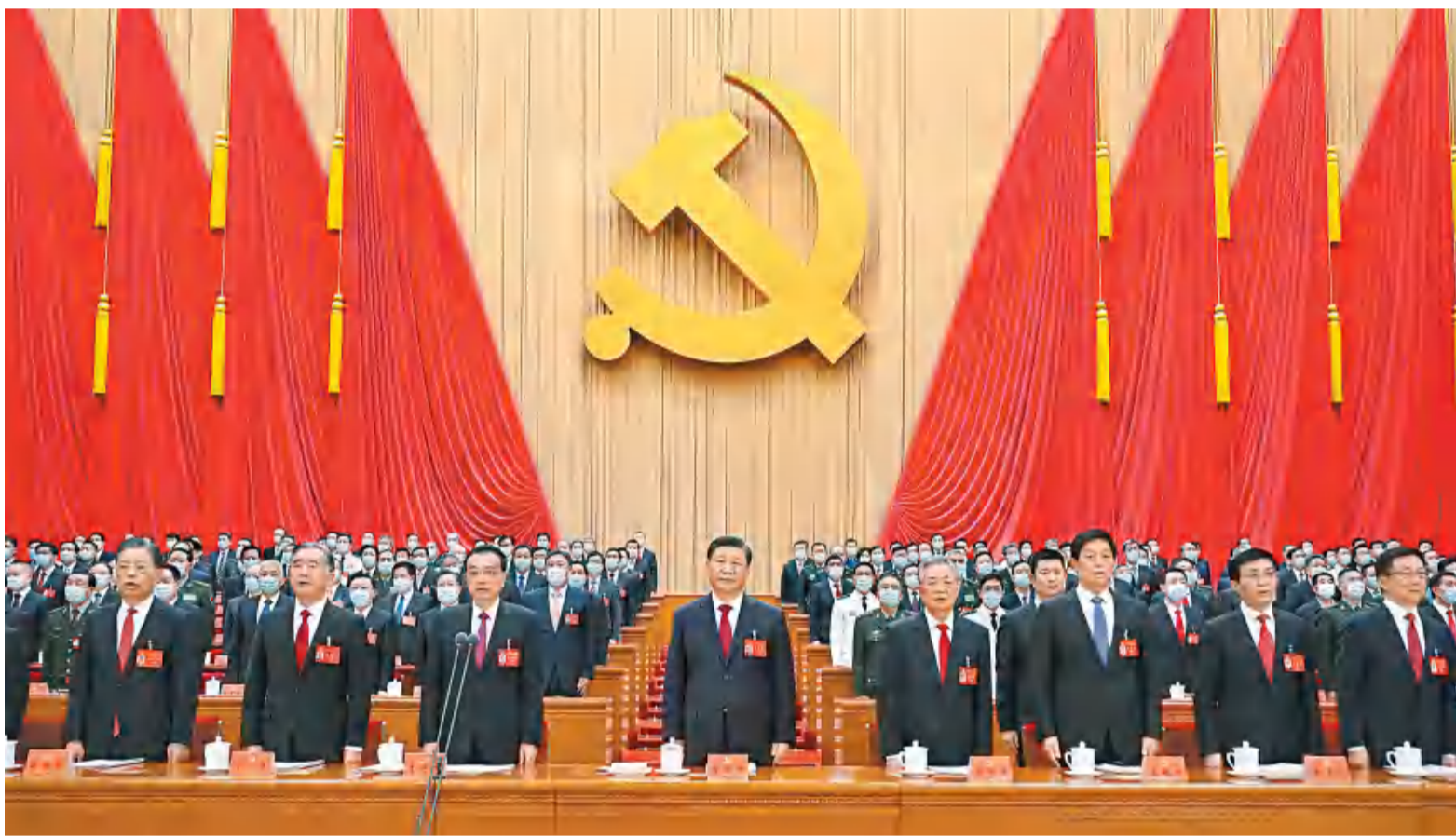
10月16日,中国共产党第二十次全国代表大会在北京人民大会堂开幕。习近平代表第十九届中央委员会向大会作报告。