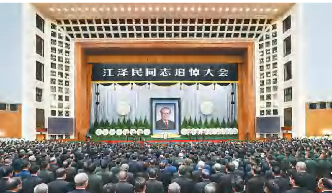
12月6日，中共中央、全国人大常委会、国务院、全国政协、中央军委在北京人民大会堂隆重举行江泽民同志追悼大会。