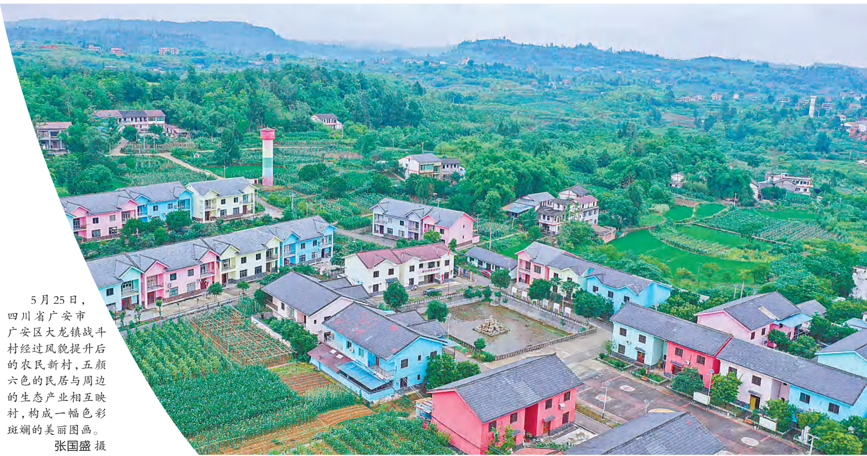
5月25日，四川省广安市广安区大龙镇战斗村经过风貌提升后的农民新村，五颜六色的民居与周边的生态产业相互映衬，构成一幅色彩斑斓的美丽图画。

近年来，乡村游是比较热门的旅游方式，市场需求潜力很大，发展前景非常广阔。如何才能激活美丽经济呢？笔者建议，首先，要因地利制宜造“风景”。各地可以因地制宜、因村施策，充分发掘和盘活乡村自然景观、特色产业、历史遗存、聚落建筑、民俗文化等资源，通过“资源+资本+文创”发展模式，坚持微改造、精提升、个性化，激活更多文旅新业态，让美丽的风景变成美好的“钱景”。其次，要农旅融合留“乡愁”。美丽乡村的内涵在于乡愁乡韵，从实践经验来看，乡村旅游发展比较好的地方大多是采取“乡愁”带动“乡游”的发展模式。因此，在打造美丽经济过程中，应充分考虑农村实际，让乡村留住记忆，让人们记住乡愁。第三，在差异化中谋发展。打造美丽经济贵在特色，要以鲜明的个性和特色取胜，切忌“千村一面”。同时，以满足广大游客体验乡村生活需求为目标，推动旅游度假、特色小吃、休闲养生、文化创意、展示展览等深度融合，使乡村旅游呈现百花争艳、万紫千红的兴旺局面。