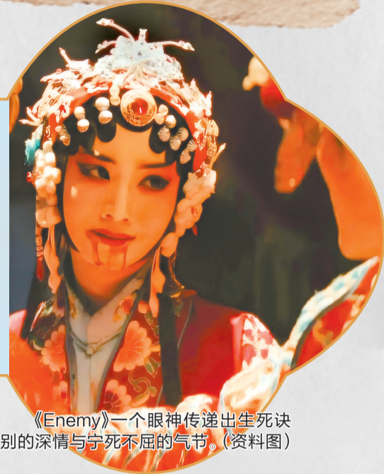
《Enemy》一个眼神传递出生死诀别的深情与宁死不屈的气节。（资料图）

短剧行业的未来，不在算法里，而在创作中。坚守真诚初心和内容底线，让技术服务于情感表达，赋能于精品创作，深耕故事、打磨细节、传递温度，才能走出同质化困局，彻底撕掉“粗制滥造”的标签，让国产短剧真正实现高质量发展，拥有持久的生命力。