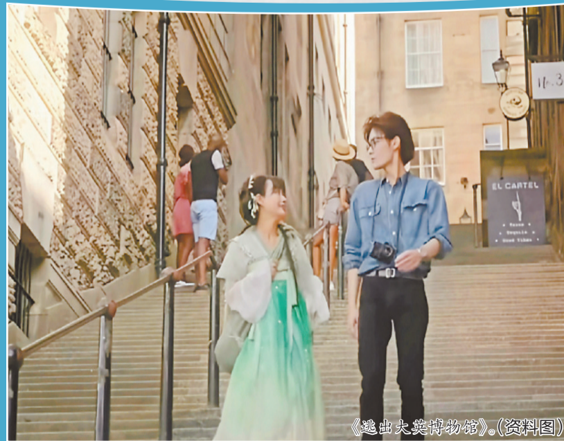
《逃出大英博物馆》。（资料图）