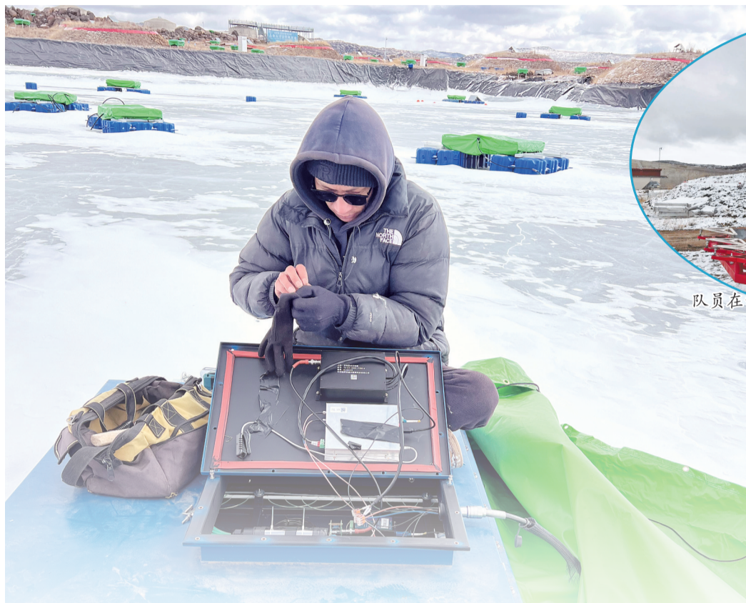
队员在结冰的湖面上检查电磁粒子探测器。