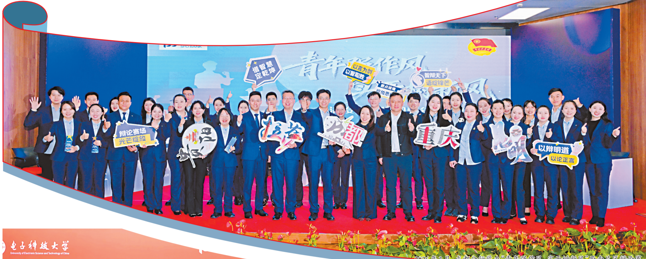
2026年3月，成都分行举办“青年强作风，实干铸航风”西南片区辩论赛。

成都分行全面落地总行数智化发展战略，精耕科技金融、供应链金融、普惠金融、跨境金融、财富金融五大赛道，深耕细作金融“五篇大文章”，走出差异化布局、特色化经营、内涵式发展的成长之路，在服务治蜀兴川大局中稳健笃行、阔步奋进。