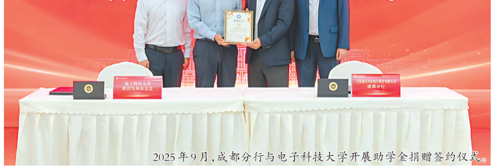
2025年9月，成都分行与电子科技大学开展助学金捐赠签约仪式。

面对金融变革浪潮，唯有创新突破，方能赢得未来。成都分行坚定践行总行“数智化”战略，遵循“赛道+区域+行业+产品”“链主+核心客群”经营范式，推动多赛道协同布局、联动发展。2025年，成都分行赛道经营整体KPI考核位列全行第6位，供应链金融、跨境金融、财富金融三大赛道业绩稳居全行前三。