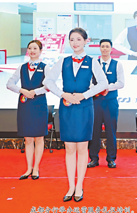
成都分行举办运营服务礼仪培训。

党风廉政建设正风肃纪。常态化落实中央八项规定精神，持续强化作风建设与党风廉政建设。常态化开展专题学习、交流研讨、警示教育及专题党课，组织全员线上廉政测试。对照问题清单深入自查自纠，班子及各基层支部累计查摆整改问题106项。紧盯招待费用等重点领域做实专项监督，规范运用监督执纪第一种形态开展谈话提醒。打造3家网点廉洁文化特色品牌，完成12个基层支部巡察及4次巡察整改“回头看”，以精准有力的政治监督护航全行合规稳健运营。