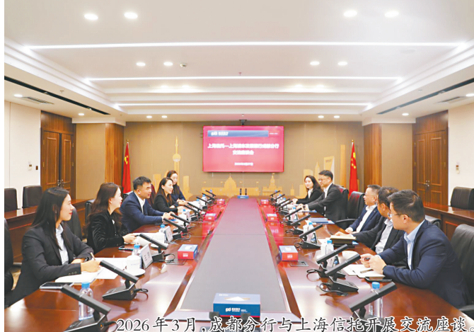
2026年3月，成都分行与上海信拓开展交流座谈。

成都分行以“人才强基”与“管理赋能”双轮驱动，为高质量发展筑牢坚实基础。深耕人才沃土。坚持“三好两高”导向，大胆起用青年才俊，90后储备干部较2024年增加18人，干部队伍平均年龄41.22岁。新引进员工85名，全行正式在职员工达835人，营销条线占比超四成。践行“考勤、考核、考试、考证、考廉”五考机制，依托“蓉智课堂”线上微课、内训师微课等载体，开展分层分类培训50余场次，覆盖1万人次，低职级员工净晋升率达52%，累计助力经营