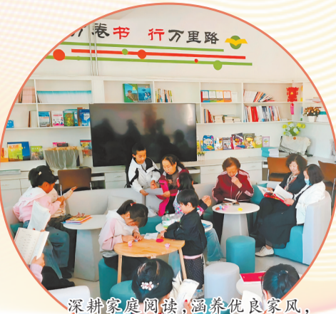
深耕家庭阅读，涵养优良家风，盐湖社区组织开展亲子共读活动。

针对党员干部群体，格尔木市将阅读与理论学习、党性教育深度融合，各社区、单位、企业专门配备红色教育、政策理论、家风家教等相关书籍，常态化开展