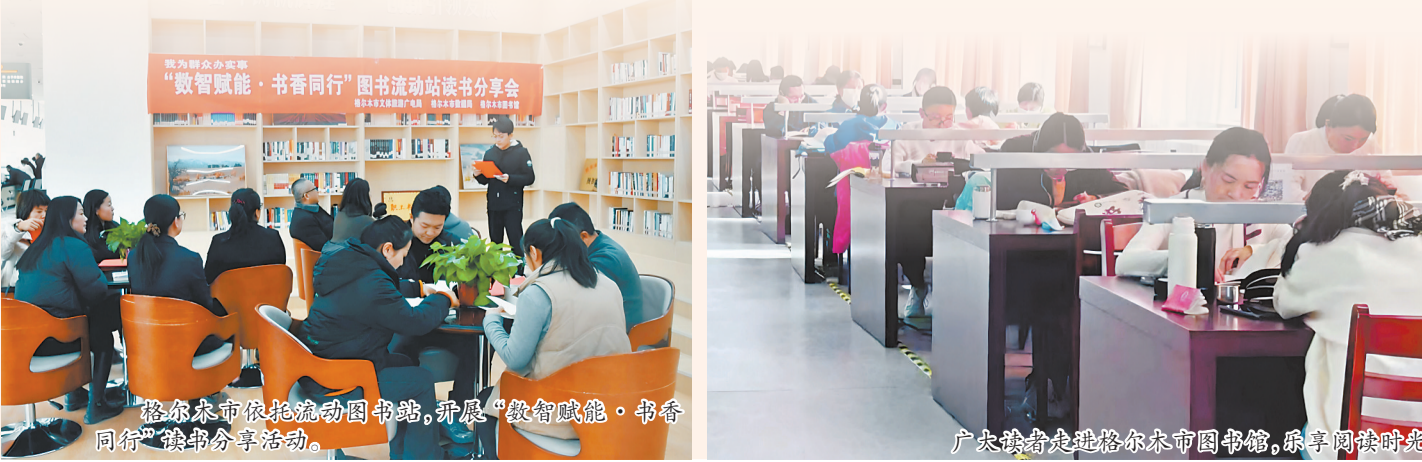
格尔木市依托流动图书站，开展“数智赋能·书香同行”读书分享活动。