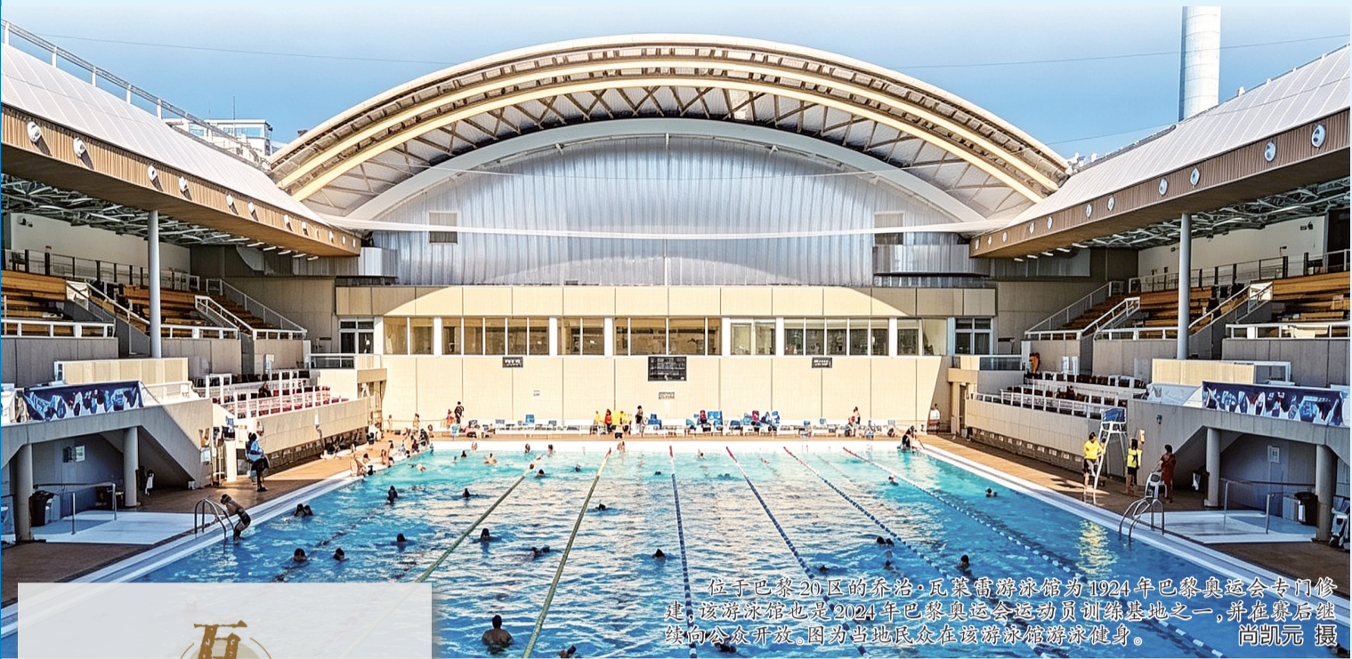
位于巴黎20区的奈洛·瓦莱蒂游泳馆为1924年巴黎奥运会专门修建,该游泳馆也是2024年巴黎奥运会运动员训练基地之一,并在赛后继续向公众开放,因为当地民众在该游泳馆游泳健身。

从茶叶到茶饮,从熊猫玩偶到IP文创,从丝绸瓷器到智能科技……近年来,外国游客的来华“必买清单”不断“上新”。 数据显示,2025年入境外国游客3517万人次,同比增长30.6%,入境游客总花费同比增长39.2%。清单之变,成为观察中国品牌发展的窗口。 新消费“爆款”——中国设计登上世界舞台。在上海,山下有松等国货时尚品牌门店外,常能见到拖着行李箱的外籍游客排队等候。同时,中国新消费品牌正加速走向全球。